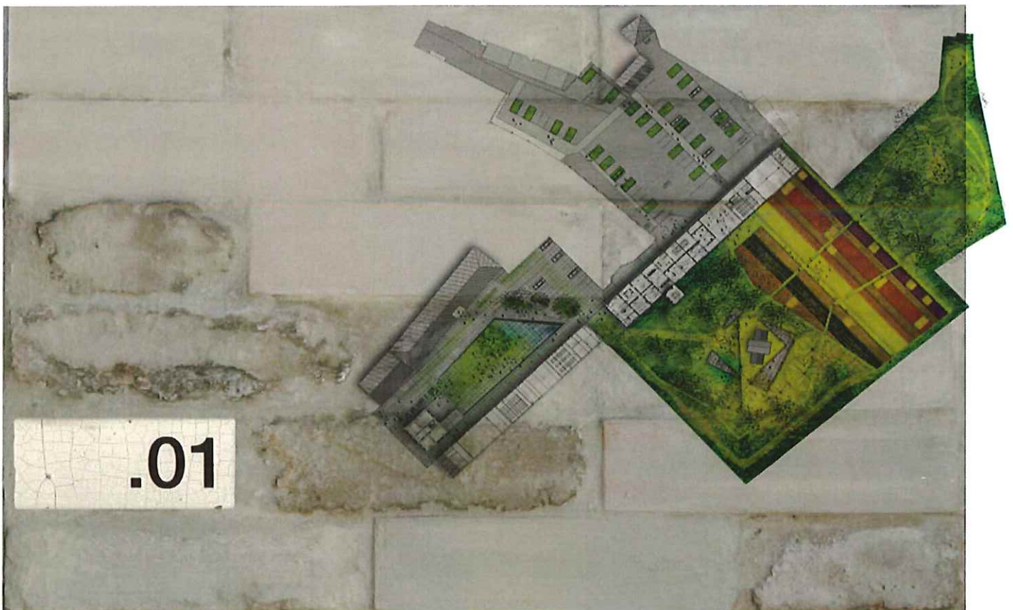
Essai d'inclusion d'une brique-cartel émaillée. Le numéro renvoie à un document disponible à l'accueil du musée, comprenant les descriptifs, provenances des matériaux.